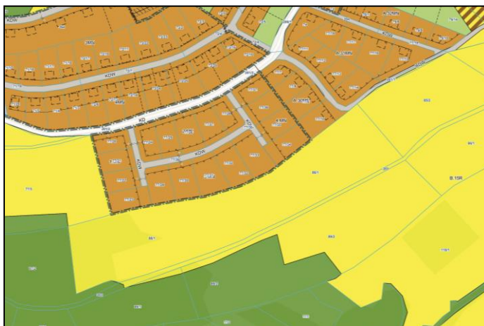
Rys. 2. Wrys z obowiązującego planu.

Głównym celem zmiany planu jest przeznaczenie terenów użytkowanych rolniczo w granicach działek 86/1 i 89/2 obr. Niedźwiedzica pod tereny zabudowy zagrodowej na potrzeby właścicieli nieruchomości.