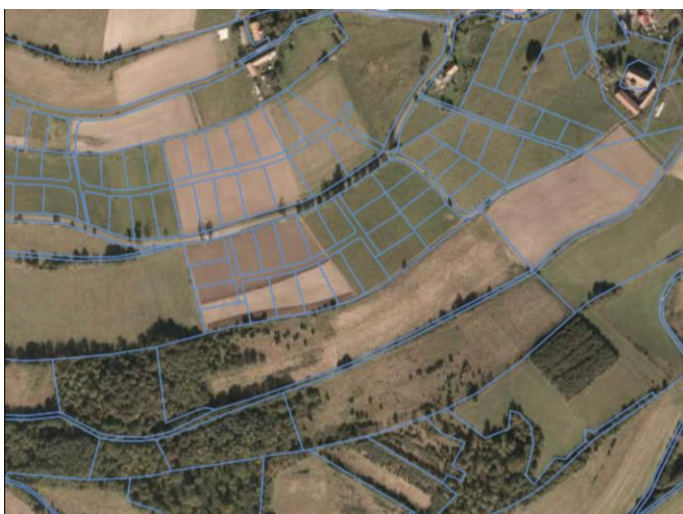
Rys.1. Obszar proponowany do objęcia planem

Teren, proponowany do objęcia miejscowym planem zagospodarowania przestrzennego dla obszaru położonego w obrębie wsi Niedźwiedzica, gm. Walim, zlokalizowany jest w zachodniej części wsi. Obecnie obszar ten stanowi tereny łąk i zadrzewień. Powierzchnia opracowania wynosi ok. 7,23ha.